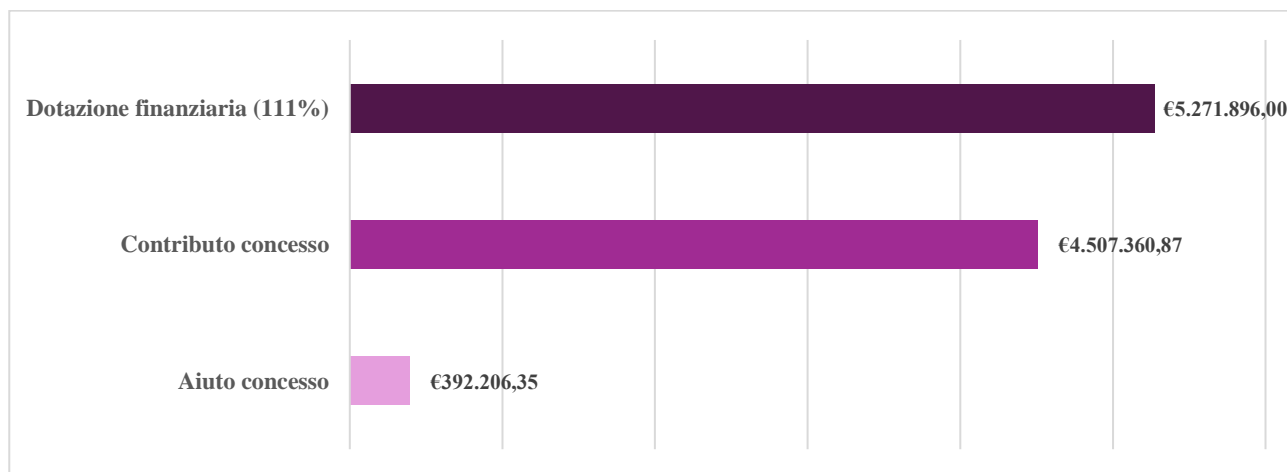
Grafico n.2 – Stato di avanzamento finanziario